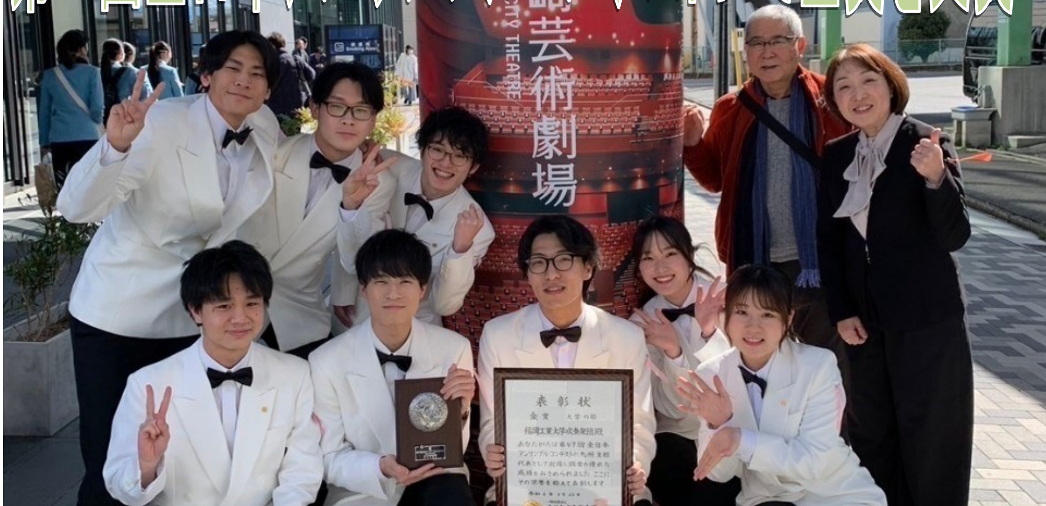
表彰式のあとの集合社員 金賞受賞を喜ぶ楽団員の姿